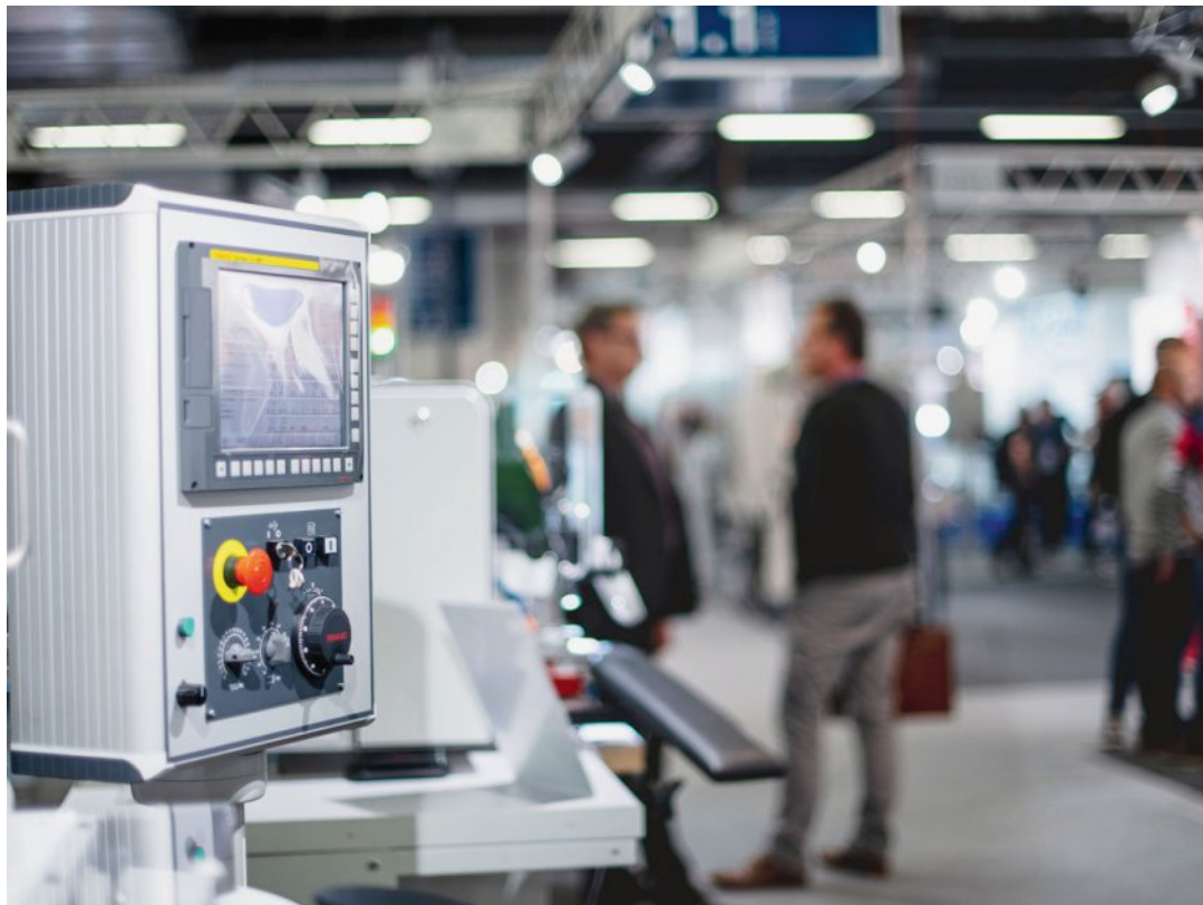
Le SIAMS reste la vitrine des compétences microtechniques de l'Arc jurassien. LDD

L'APFC (anciennement Ecole jurassienne de perfectionnement) œuvre depuis plus de 50 ans et, si elle reste assez méconnue du grand public, elle est très active, notamment au niveau des certificats de base en mécanique et CNC et d'initiation en technique horlogère